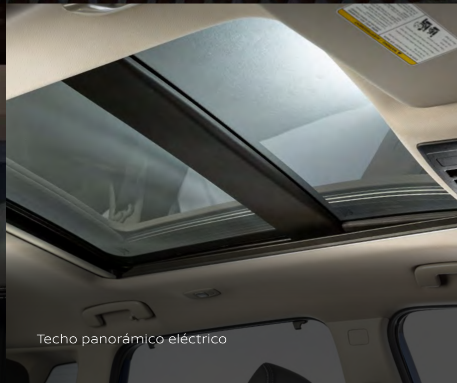
Techo panorámico eléctrico