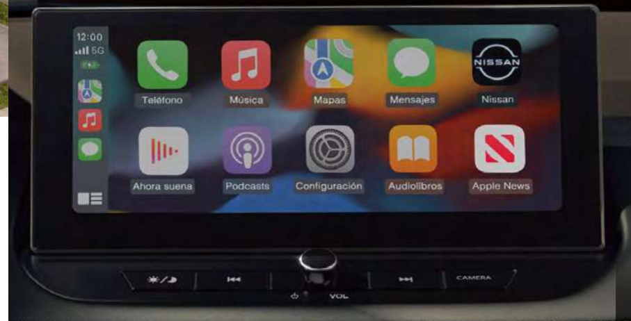
Pantalla digital 12.3"