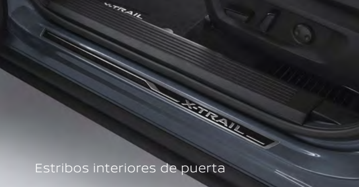
Estribos interiores de puerta