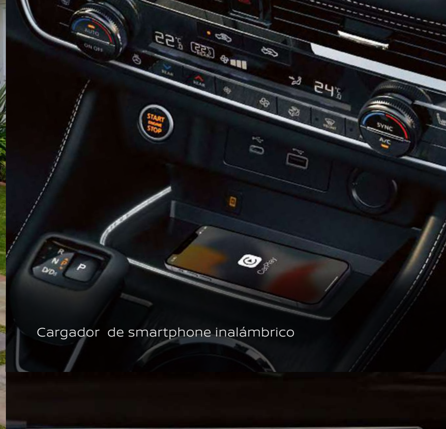
Cargador de smartphone inalámbrico

Imágenes de referencia. Los accesorios mostrados pueden venderse por separado. Consulta la ficha técnica para conocer el detalle de especificaciones. Consulta nivel de equipamiento y disponibilidad por versión y zona geográfica con tu Distribuidor Autorizado Nissan o visítanos en Nissan.com.mx