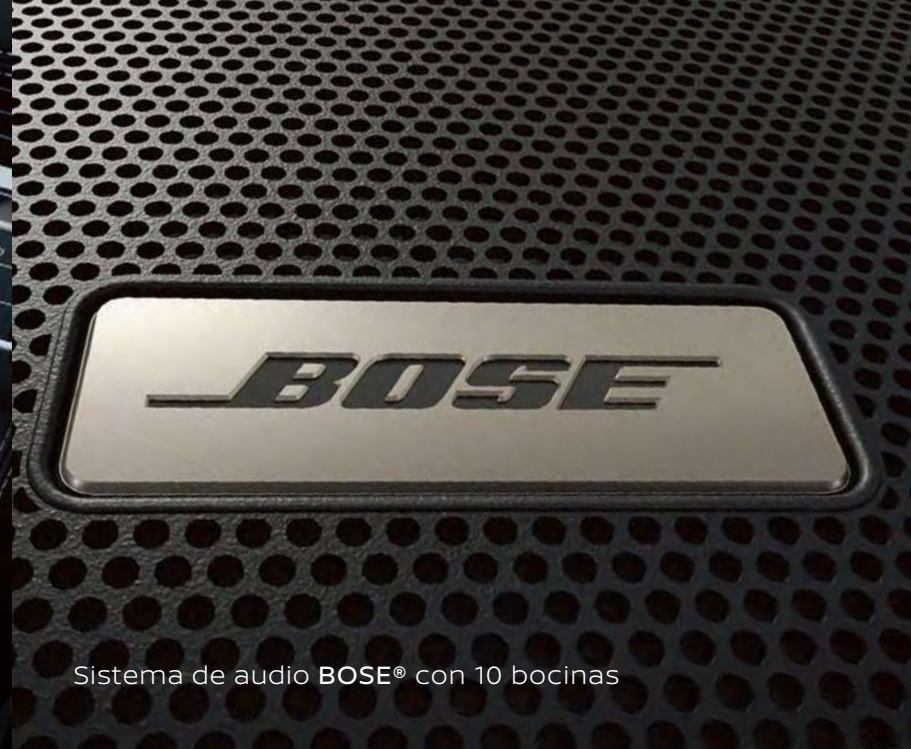
Sistema de audio BOSE® con 10 bocinas