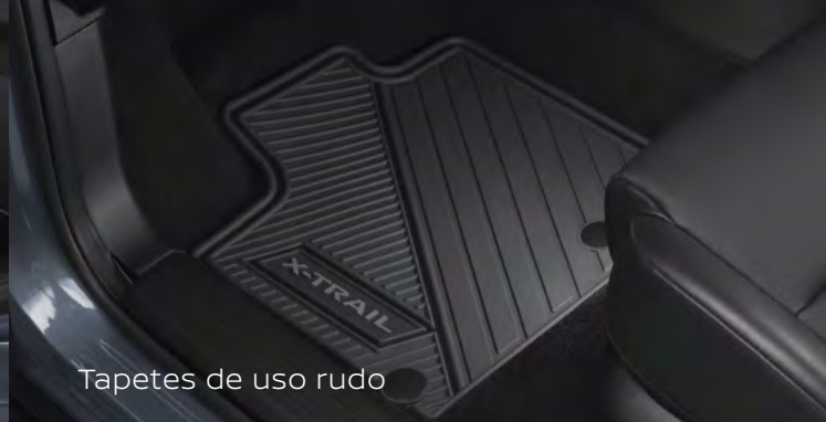
Tapetes de uso rudo