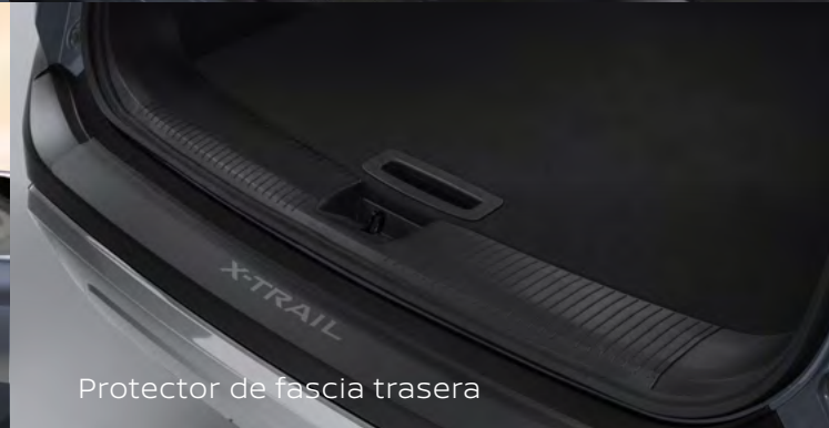
Protector de fascia trasera